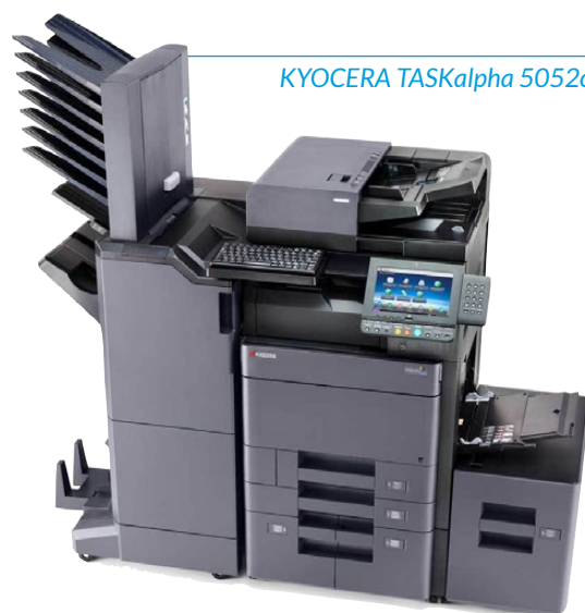
KYOCERA TASKalpha 5052ci

Behalve dat Adviesgroep Van der Roest zijn printers gebruikt om grote volumes drukwerk te vervaardigen, worden ze ook ingezet voor het digitaliseren van dossiers.